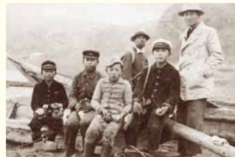
色丹島色丹村チボイの少年たち

第二次世界大戦が終わるまで北方領土の4つの島には、1万7,291人の人々が住んでいました。この中には、みなさんと同じ小学生もたくさんおり、小学校が39もありました。