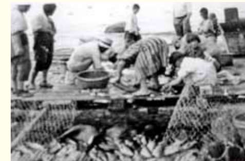
家族一緒にマスの塩蔵加工をする (択捉島留別村)

みなさんは今どんな遊びをしていますか。あの頃の島の子どもたちは、とにかく外で遊ぶことしかなかったですよ。夏は川や海で釣りやカモメの卵を捕り、女の子はなわとび、ままごと、2年生頃になると針をもって、残り布でお人形をつくり、着せ替えをして遊びました。秋にはハマナス、ガンコウラン、岩ツツジなどの木の実・草の実を採りジャムにしたりおやつがわりに食べたりしました。山や川、海がすばらしい遊び場でした。冬はととてもきびしいです。吹雪の日が多く電気、ガス、水道もありません。今の生活と比べると不便だと思うかもしれませんが、島の人たちは仲良く、平和に暮らしていました。