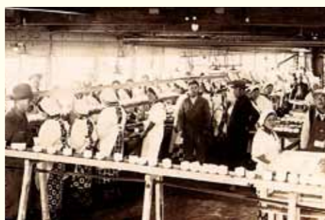
歯舞群島志発島のかんづめ工場