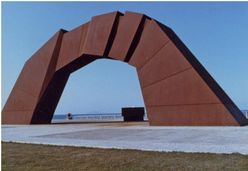
納沙布岬に建てられた北方領土返還のシンボル「四島のかけ橋」

この灯は、祖国復帰が実現した沖縄の南端、波照間島 はてるま で採火され、青年団体による全国縦断キャラバン隊によって、はるばる納沙布岬に運ばれました。また、そのそばには、全国の都道府県から寄せられた自然石を敷きつめた、「希望の道」がつくられています。