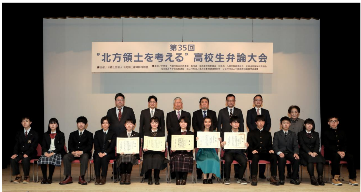
“北方領土を考える” 高校生弁論大会（札幌市：札幌市男女共同参画センターホール）

このように国民世論が高まってきたことと並行して、国会をはじめ、すべての都道府県議会及びほとんどの市町村の議会でも、北方領土返還の実現を強く求める「北方領土返還に関する決議」が行われています。