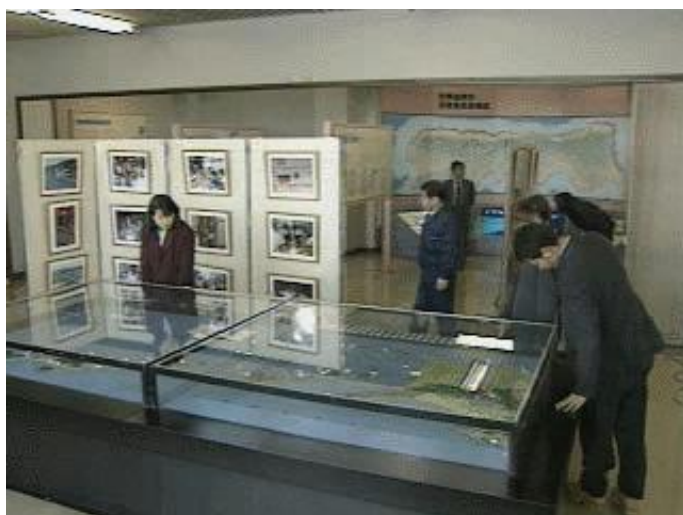
北方領土館内の様子（標津町）