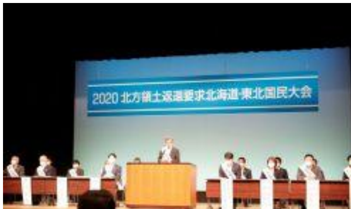
（北方領土返還要求北海道・東北国民大会：札幌市・道新ホール）

北方領土が占拠されたことは、父祖伝来の地を失うと同時に豊かな漁場までも失ったことになり、経済的な影響も大変なものでした。このようなことから根室にあがった返還要求の声は、やがて北海道内の各地にこだまし、運動の輪はしだいに広がりを見せ始めました。そして、返還を強く訴えるため 1950 年（昭和 25 年）11 月には、いろいろな団体などと道内の各自治体が一緒になって「千島及び こんせいどうめい 歯舞諸島返還懇請同盟」（1965 年（昭和 40 年）4 月に社団法人北方領土復帰期成同盟 ふっききせい となる）を発足させ、また、1955 年（昭和 30 年）5 月に北方領土の元居住者たちも、自分たちの父祖の地を返してもらおうと「千島列島居住者同盟」（1958 年（昭和 33 年）7 月に社団法人千島歯舞諸島居住者連盟となる）をつくりました。これらの団体は、政府や国会に対する陳情をはじめ、北海道の各地や道外の各都市で住民大会、講演会、北方領土展などを開くほか返還要求のための署名運動を展開し、領土の返還に対する世論を盛んにするために努めています。