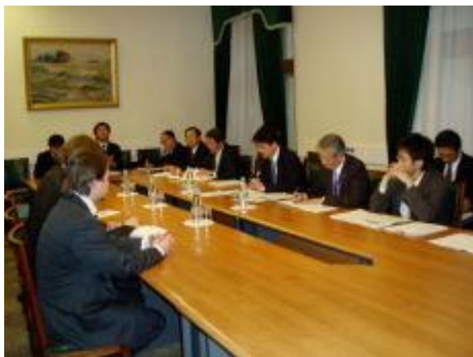
ロシア連邦政府外務省と対談する使節団の一行

また、根室市をはじめとして別海町、標津町、羅臼町には北方領土を目で見るための各種の施設がつくられ、北方領土のいろいろな資料が展示されており、全国各地から訪れる人たちに利用されています。