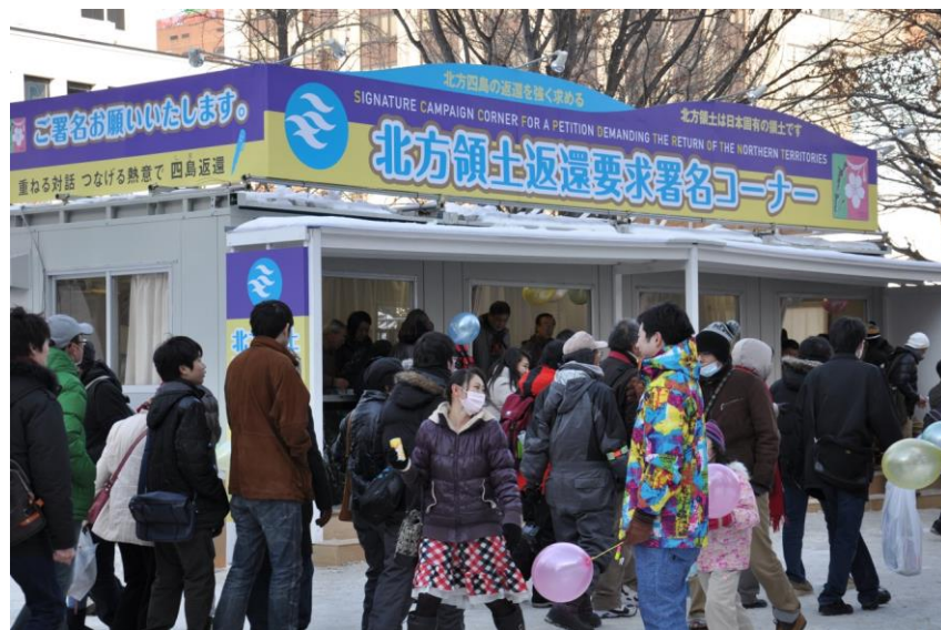
北方領土返還要求署名運動（さっぽろ雪まつり会場）

このように国民世論が高まってきたことと並行して、国会をはじめ、すべての都道府県議会及びほとんどの市町村の議会でも、北方領土返還の実現を強く求める「北方領土返還に関する決議」が行われています。