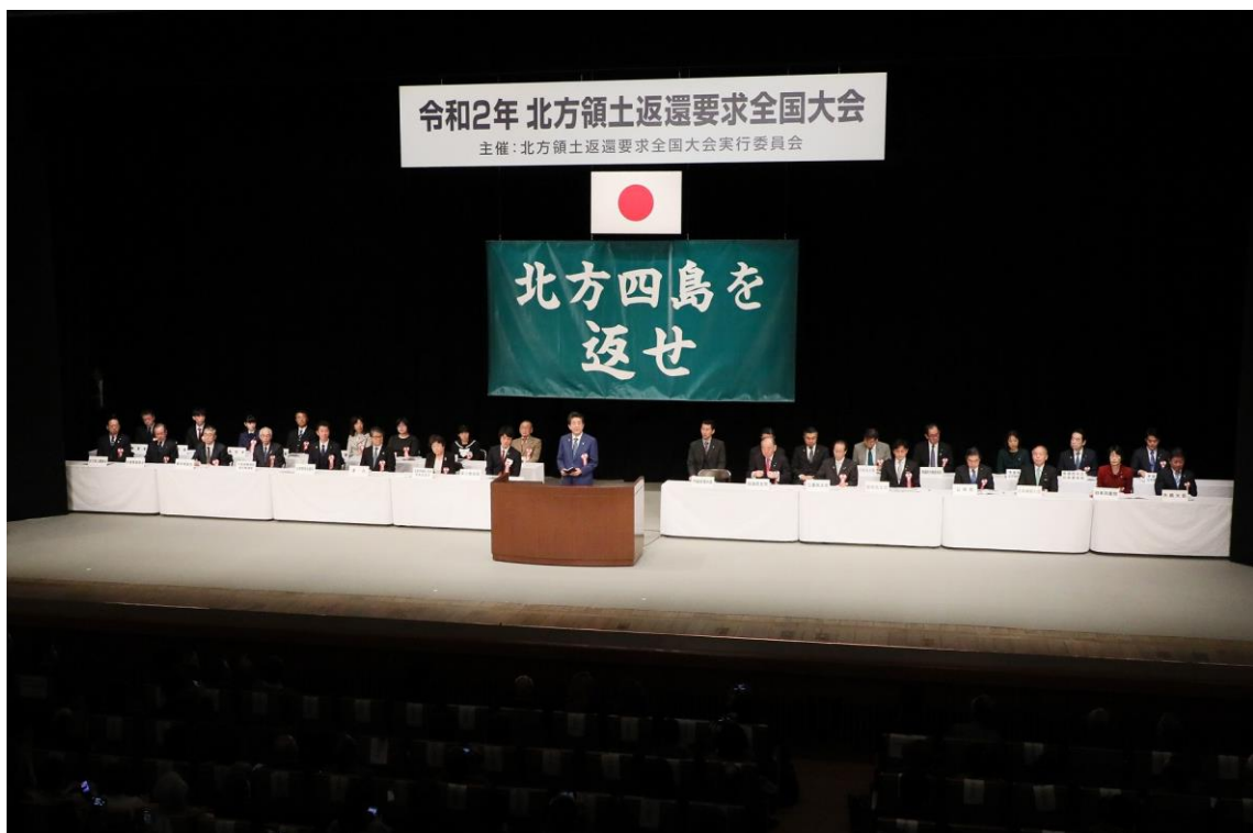
(北方領土返還要求全国大会：東京)

この日を中心にして全国的に集会、講演会、署名運動などいろいろな行事が開催され四島返還に向けての運動が、大きなうねりとなって全国各地に広がっています。