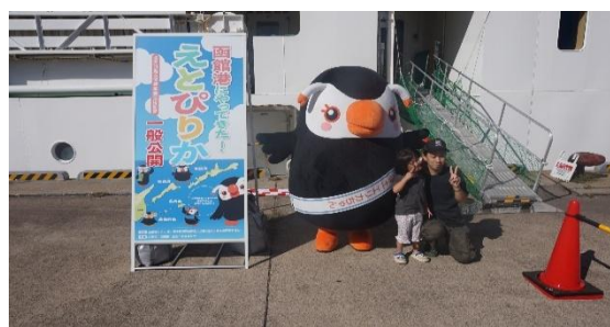
（「エリカちゃん」の出迎え）