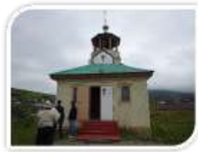
【正教会】(斜古丹) 斜古丹湾を一望する高台にある。

2014年12月完成。8科あり、ベッド数25床、外来50名まで対応可能。医師8名、看護師16名。文化会館向かいの小高い丘の上にある。