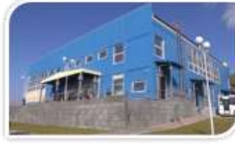
【スポーツ施設 色丹アリーナ】 2016年12月斜古丹にオープン。球技コートや道場がある