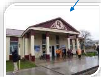
【穴澗文化会館】(穴澗) 穴澗の中心部にあり、表敬訪問などはここで行われる。土曜日はディスコとして利用される。