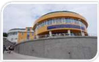
【「地区中央病院」色丹分院】 (穴澗)

2014年12月完成。8科あり、ベッド数25床、外来50名まで対応可能。医師8名、看護師16名。文化会館向かいの小高い丘の上にある。