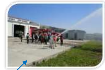
【消防署】(穴澗) 2013年6月供用開始。斜古丹地区も管轄する。

約1,200人の住民の他、国境警備隊員とその家族が暮らす。 漁業コンビナート「オストロブノイ」の基地があり、深水港のため大型船が停泊する。