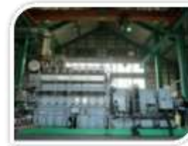
【ディーゼル発電施設】(穴澗) 1999年に日本政府の人道支援により供与した発電所。ディーゼル発電機800kW×3基。常時出力1,600kW

人口約1,000人。交流船「えとびりか」号が北方四島で唯一直接接岸できる栈橋がある。交流事業でよく使われる学校やレストランもこの村にある。