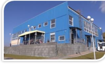
【スポーツ施設 色丹アリーナ】 2016 年 11 月斜古丹にオープン。 球技コートや道場がある