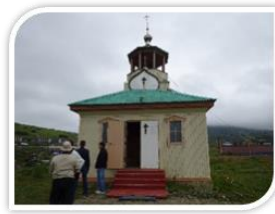
【ダニール・モスコフスキー教会】 (斜古丹) 斜古丹湾を一望する高台にある。

診療科目 8 科。ベッド数 25 床、外来 50 名まで対応可能。医師 8 名、看護師 16 名。文化会館向かいの小高い丘の上にある。