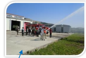
【消防署】(穴澗) 斜古丹地区も管轄する。 消防車は 2 台配備されている。