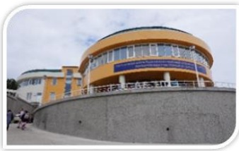
【「地区中央病院」色丹分院】 (穴澗)

診療科目 8 科。ベッド数 25 床、外来 50 名まで対応可能。医師 8 名、看護師 16 名。文化会館向かいの小高い丘の上にある。