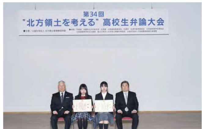
最優秀賞・優秀賞者記念写真