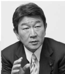
外務大臣 茂木 敏充

「第34回“北方領土を考える”高校生弁論大会」の開催に当たり、北方領土問題に高い関心を持ち、本日の弁論大会に参加されている高校生の皆さん、そして、日頃から若い世代の方々に対する啓発活動に取り組んでいる皆様に対し、心から感謝と敬意を表します。