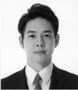
北海道知事 鈴木 直道

「第34回“北方領土を考える”高校生弁論大会」に、多くの皆様のご参加をいただき心から感謝を申し上げますとともに、本大会の開催にご尽力いただいた関係の皆様へ厚くお礼申し上げます。