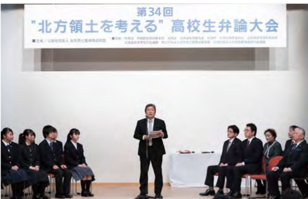
(審査員長による講評)