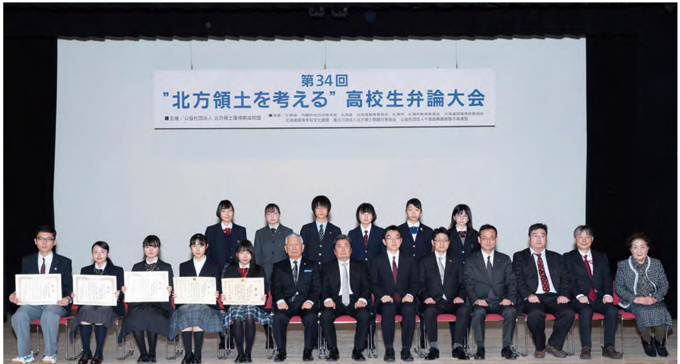
参加者全員による記念写真